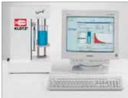
Программа сбора и обработки данных для счетчика Syringe®