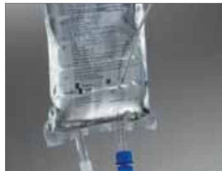
Отбор проб из пакета для инфузий