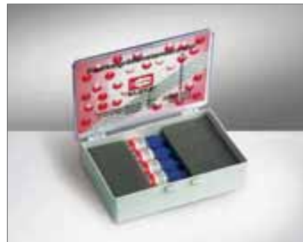
Набор для калибровки