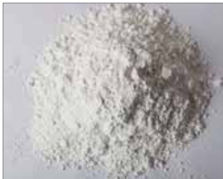
Анализ размеров частиц в диапазоне от 1–200 мкм