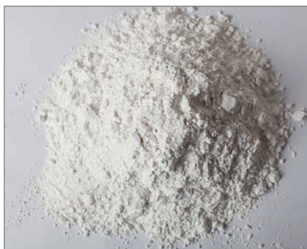
Анализ размеров частиц в диапазоне от 1–200 мкм