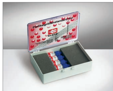
Набор для калибровки