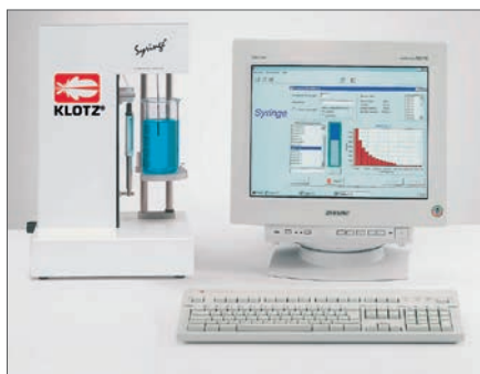
Программа сбора и обработки данных для счетчика Syringe®