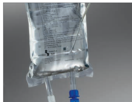
Отбор проб из пакета для инфузий