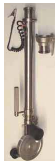
Трос МК 7

В комплектацию троса включен специальный крюк, с помощью которого можно быстро и безопасно менять пробоотборники.