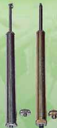
Пробоотборник для взятия проб отложений