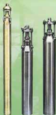
Пробоотборники для взятия проб с любого уровня