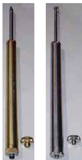
SDMNT 201 SDMNT 502