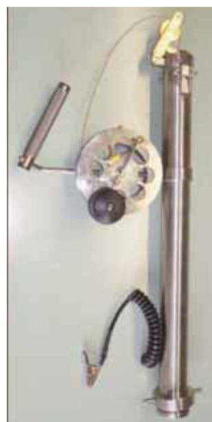
Трос МК 2

В комплектацию троса включен специальный крюк, с помощью которого можно быстро и безопасно менять пробоотборники.