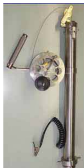
Набор 1 В/МК2

Для взятия проб система устанавливается непосредственно на газовый клапан резервуара с помощью соответствующего адаптера.