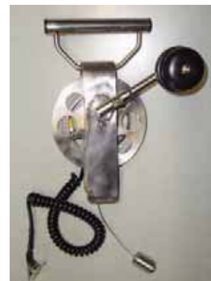
Трос МК 1В