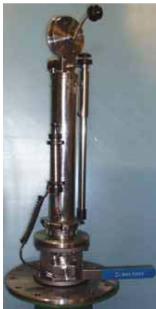
Набор 4 МК10