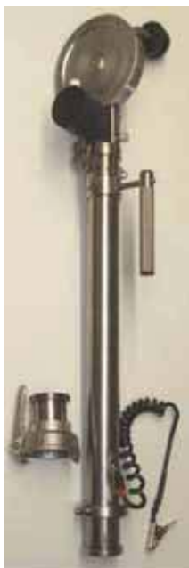
Набор 3 МК7