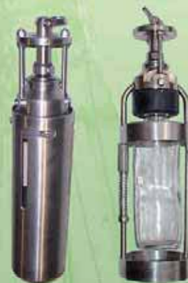
Пробоотборники со съемным контейнером