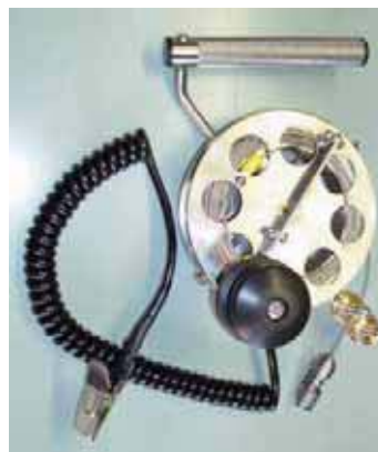
Трос МК 1А

Рукоятка троса включает в себя блокирующий механизм катушки, что позволяет оператору наматывать и блокировать катушку одной рукой.